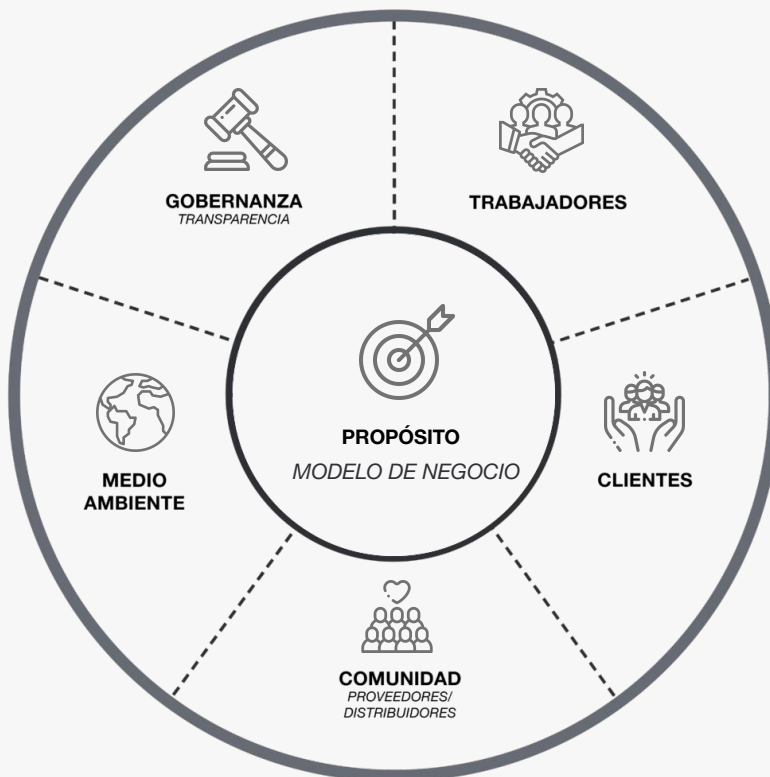
Figura 1. Modelo de Evaluación

a las diferentes actividades y dimensiones empresariales para que cualquier empresa pueda adoptarlo como propio.